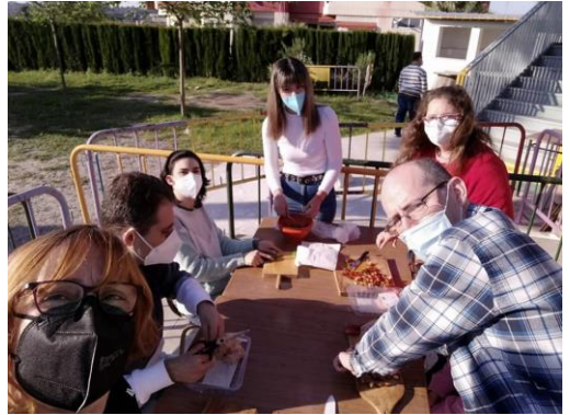
Talleres de cocina