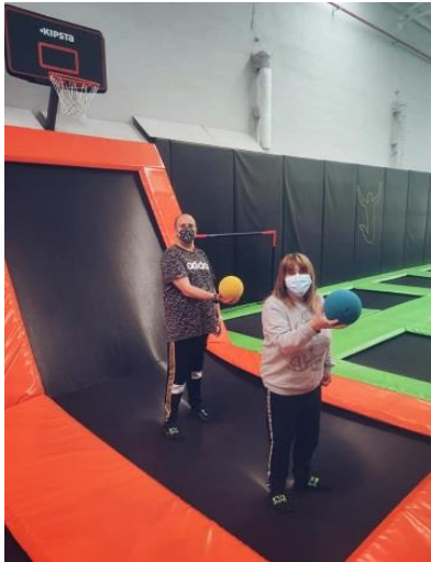
Visita al parque de camas elásticas