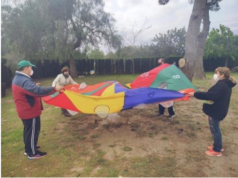
Dinámicas al aire libre